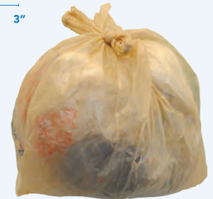
Asegure las bolsas de plástico dentro de una bolsa.