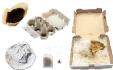
UNCOATED SOILED PAPER PAPEL SUCIO SIN RECUBRIMIENTO