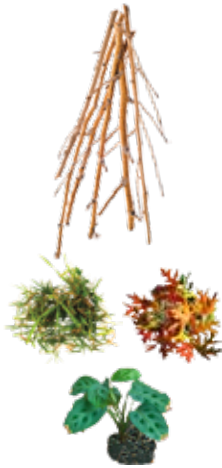
PLANT TRIMMINGS DESECHOS DE JARDÍN