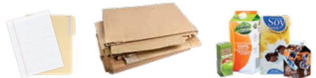
PAPER, FLATTENED CARDBOARD, AND CARTONS PAPEL, CARTÓN PLANO Y CARTONES

Don't know where something goes? ¿No sabes en dónde van las cosas?